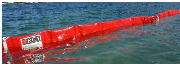
BEACH BOOM sur basse Barracuda à mousses plates