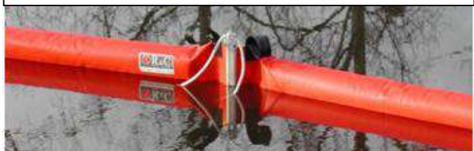
BEACH BOOM sur base Goéland à mousses rondes

Très rapide à mettre en œuvre BEACH BOOM est utilisé à titre préventif.